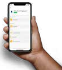
ekey bionyx app Per smartphone e tablet